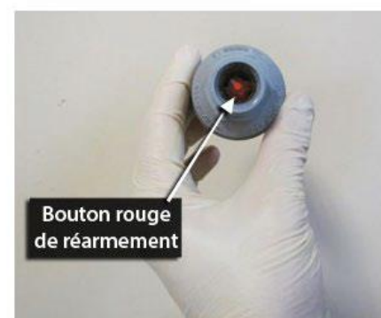
fig. 3-Bouton rouge de réarmement