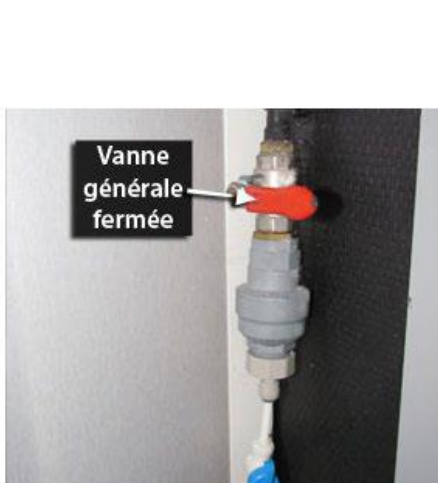
fig. 1-Vanne générale fermée