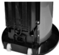
Roulettes de transport intégrées

The Carbon block filtration kit 100% hygienic 5000L water treatment